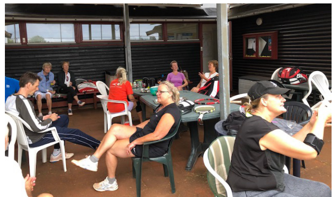
Fra Aperol Cup 2019. Afslapning mellem kampene og i pauserne.

Reglerne er overordnet, at man spiller i par af 2, holdet som vinder drikker en tår og vinderne vil få sværere ved at ramme den gule bold og pludselig skifter rollerne (måske).